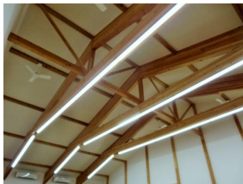
天井の高い多目的スペース室