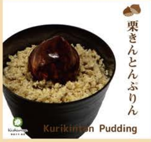
栗きんとんぷりん