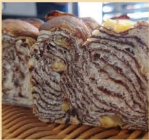
和栗入りもちりショコラブレッド