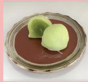
シャインマスカット大福