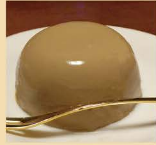
りっちゃんのジーマミ豆腐