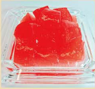
あまおう苺のわらび餅