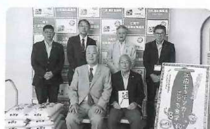
▲江南ロータリークラブ様からお米100kgの寄贈