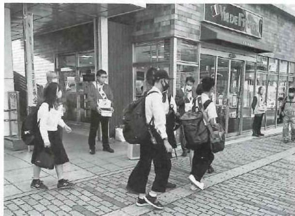
▲昨年度の募金活動の様子

今年も江南市では、江南市共同募金委員会(社会福祉協議会内に設置)が窓口となって、自治会を通じての戸別募金や市内各駅・スーパーでの街頭募金、学校・企業などでも募金活動が行われます。