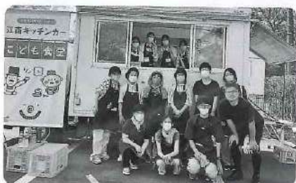
▲総勢31名のボランティアの方にご協力をいただきました