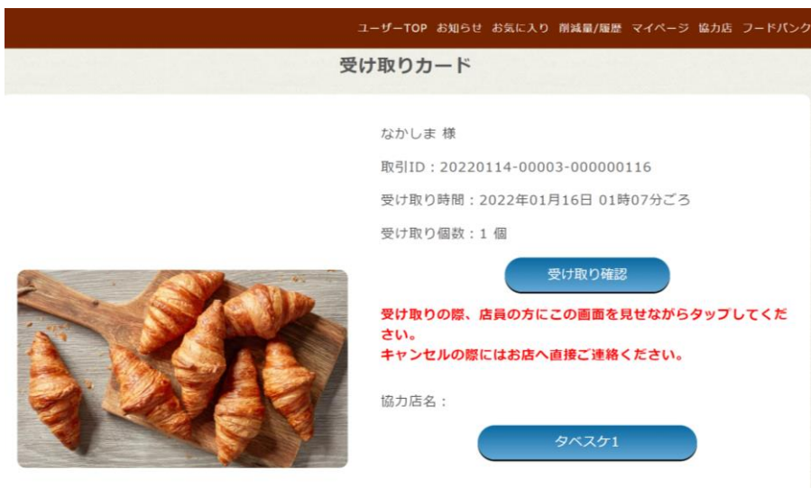
▲ユーザー側の受取確認ボタンの画面

購入予約を行うと、商品ページのトップに「受け取りカード」が表示されます。お店で商品を受け取る際には、この「受け取りカード」を掲示してください。 受け取りが完了したら「受け取り確認」ボタンを押して完了です！