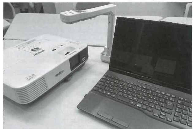
▲プロジェクター、OHC、パソコン機器