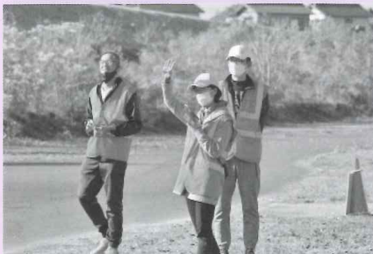
▲ボランティアはベストを装着