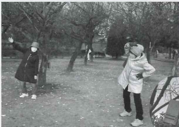
感染対策のため、ラジオを3カ所に置き、分かれて実施