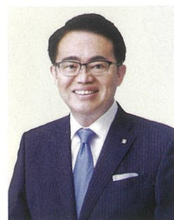
日本赤十字社愛知県支部 支部長