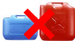
ガソリンの貯蔵に適さない容器の例 (樹脂製容器は火災危険性が高い)