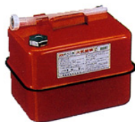
ガソリンの貯蔵に適した容器の例 (金属製容器であることが必要)