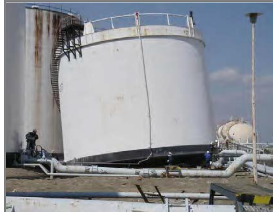
津波により浮上・移動したタンク (地震時は空)