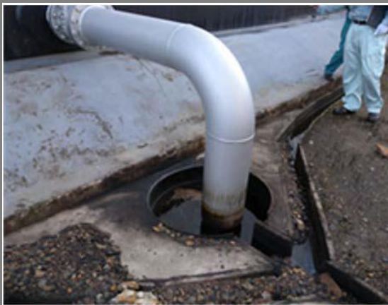
スロッシングにより浮き屋根上に溢出し た油がルーフドレン配管から流出