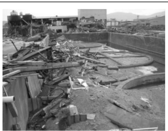
津波によりタンクが移動した タンクヤード