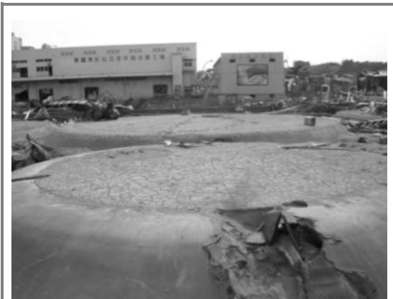
津波によりタンクが移動した タンク基礎