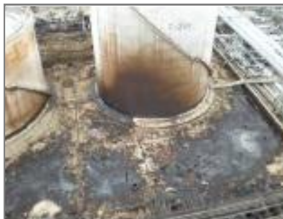
配管の破損により 重油が流出したタンク