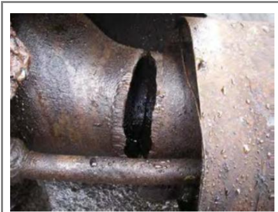
配管の破断部拡大