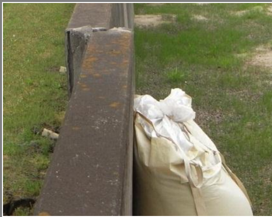
液状化による防油堤の沈下、 破断状況