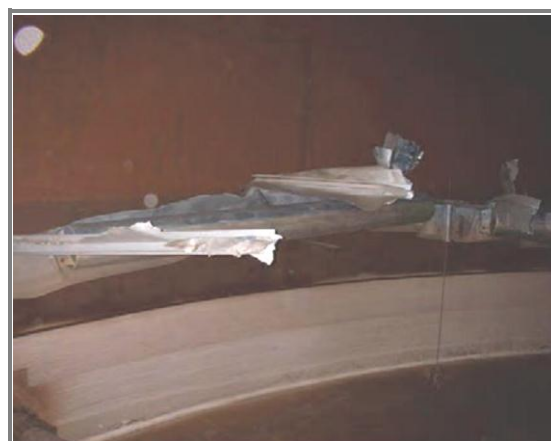
スロッシングにより破損したタンク 側板付近の浮き蓋の損傷状況