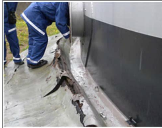
地盤の不等沈下によるタンクの沈下、 アニュラ板付近の変形状況