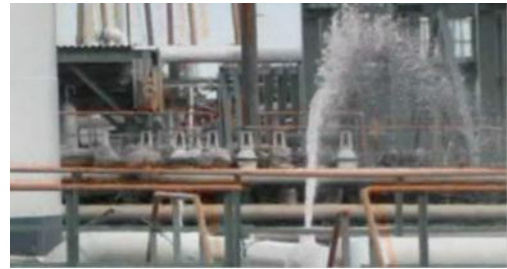
配管の破断部から噴出するガソリン