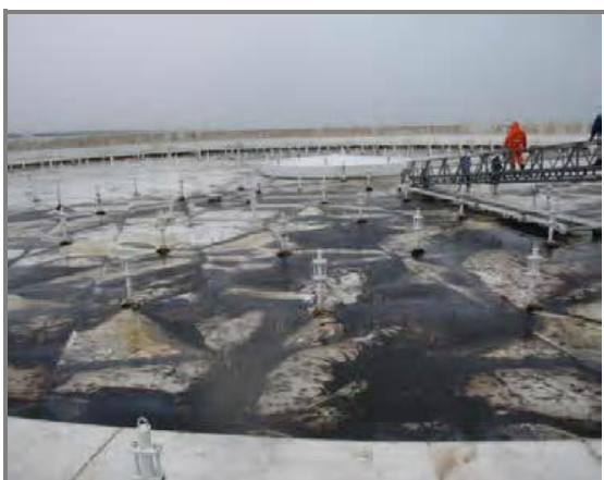
スロッシングにより 原油が溢流した浮き屋根上部の状況