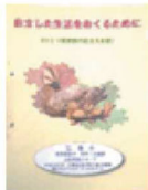
ひとり親家庭への支援をまとめた冊子