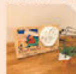
ファーストメモリー