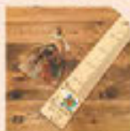
メモリーメーター