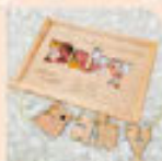
メモリーフォトフレーム