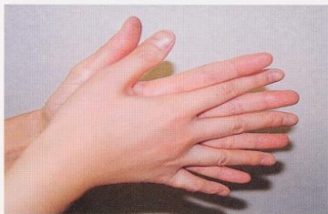
1. 手のひらを合わせ、よく洗う