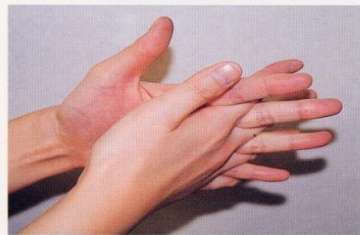
4. 指の間を十分に洗う