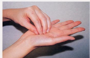
3. 指先、爪の間をよく洗う