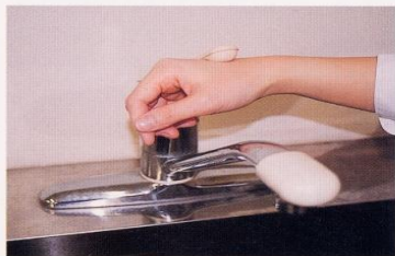
7. 水道の栓を止めるときは、手首か肘で止める。できないときは、ペーパータオルを使用して止める