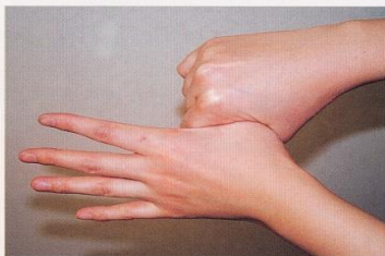
5. 親指と手掌をねじり洗いする