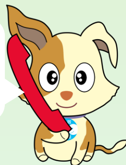
行政相談マスコット「キクーン」

困っていることがあるけど、国のことか、県や市のことか分からない時も相談できるよ。