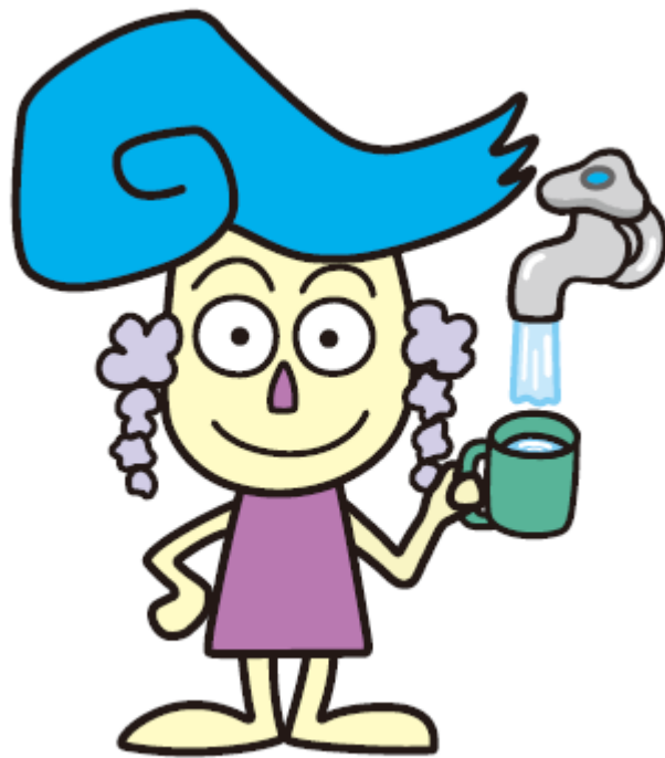
江南市マスコットキャラクター「藤花ちゃん」