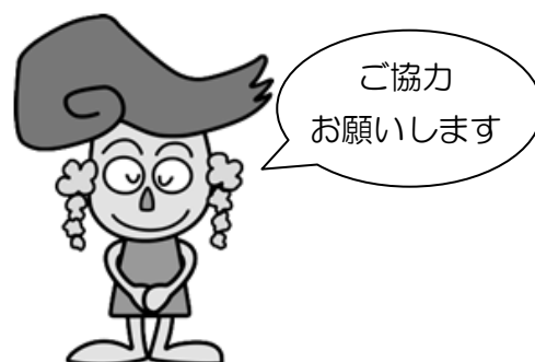
江南市マスコットキャラクター 「藤花(ふじか)ちゃん」

江南市 健康福祉部 福祉課 福祉計画推進グループ 電話：0587-54-1111 (内線 253) FAX：0587-56-5515 E-mail：fukushi@city.konan.lg.jp