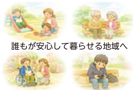
誰もが安心して暮らせる地域へ

①包括的相談支援 ②地域づくり ③参加支援 ④アウトリーチなどを通じた継続的支援 ⑤多機関協働の5つの事業で構成され、一体的に実施することで、高齢者・障がい者・子ども・子育て・生活困窮の分野を超えた相談支援体制と、地域住民が主体となった課題解決体制の構築を目指します。