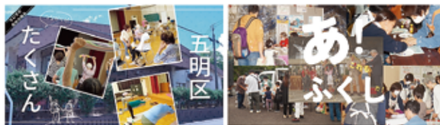
▲江南市社会福祉協議会のYouTubeには一緒に作成した動画がたくさん

動画作成を通じて、地域や社協の取り組みに関心を持ってもらうことを大切に活動しています。動画を通じて情報を求めている方の支援につなげていきます。