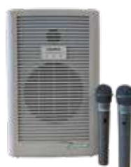
▲ワイヤレスアンプ及びマイク