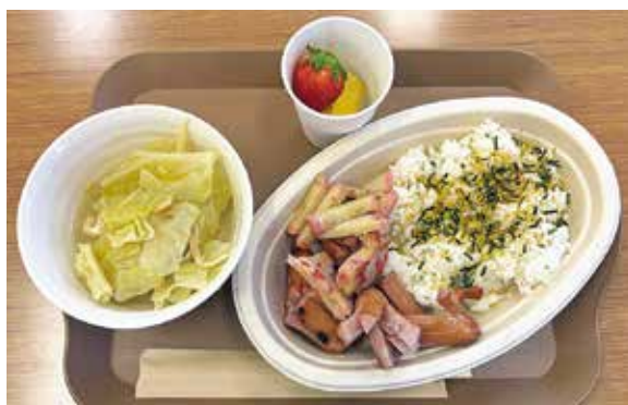
▲4月メニュー「キャベツと長ネギのお味噌汁と練りもののソテー、タコさんウインナー」