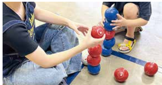
▲ご飯の提供前の時間には、遊びや勉強などをして過ごせる居場所を開催