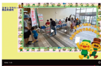
▲ボランティアの活動様子を撮影し動画編集をしています