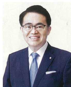
日本赤十字社愛知県支部 支部長

本年も地域に寄り添い、必要とされる支援を着実に実施してまいります。今後とも引き続きご理解とご支援を賜りますようお願い申し上げます。