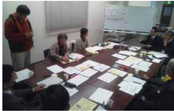
（ワークショップの様子）

ステーションの常駐スタッフを主に支えたりする“運営委員会”と、情報紙「みんなのパレット」について意見が交わされました。