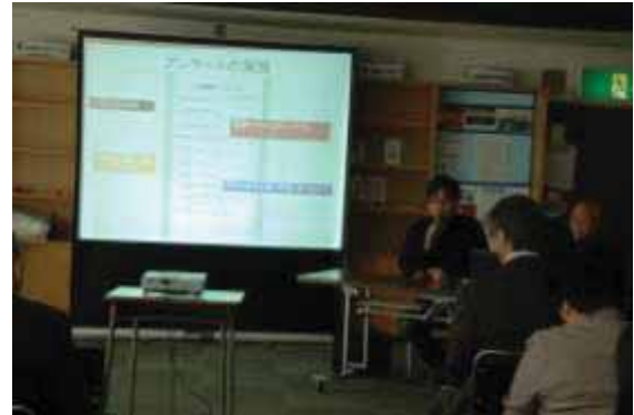
【NPO 法人 カーボンダイエットジャパン】