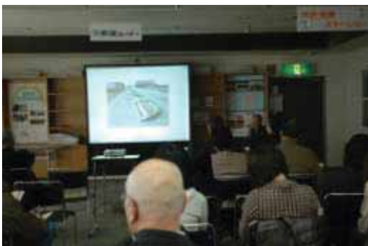
【飛高フラワーズ】 & 【フロンティアグループ】

小さな環境の変化に影響される植物を育てることは大変ですが、丁寧に作業されていました。